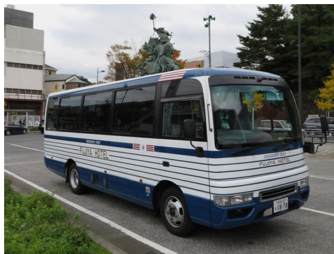
青と白のボーダーが目印です

HAKONE HOTEL FUJIYA HOTEL LAKE VIEW ANNEX