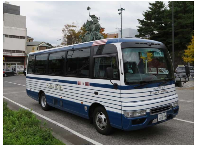
青と白のボーダーが目印です